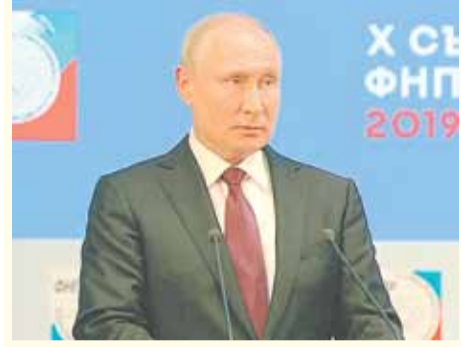
Власть должна оказывать содействие профсоюзам

Необходимо активизировать работу в формате «власть-работодатели-профсоюз»