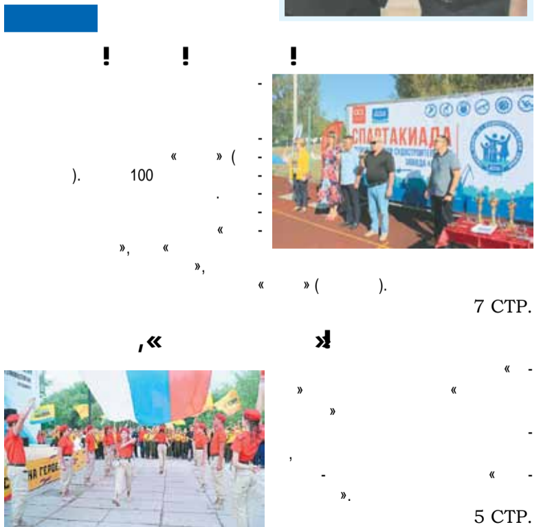
С. Семенов, корр. газеты «Вестник судостроителя»